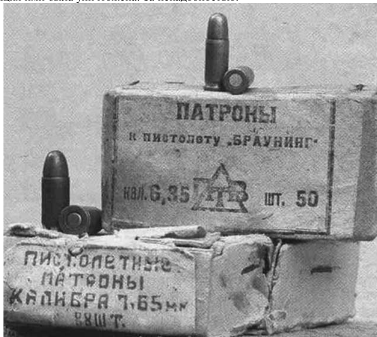
Пистолетные патроны советского производства калибров 7,65 и 6,35 мм (без маркировки на доньщиках гильз)

Ещё один важный «штрих». Согласно документам производителя «катынских» боеприпасов, все действующие контрактные обязательства немцев перед СССР закончились до 1938 года. А потому вся документация ими была уничтожена. За ненадобностью.