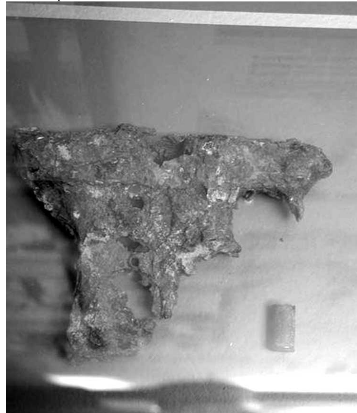
Немецкий след не вызывает сомнений. Пистолет «Вальтер», найденный польскими археологами в одной из катынских могил и переданный ими в экспозицию музея ГМК «Катынь»

Вывод очевиден: расстрелы в Катыни производились немцами в военное время с применением немецкого оружия и боеприпасов. То есть после 22 июня 1941 года.