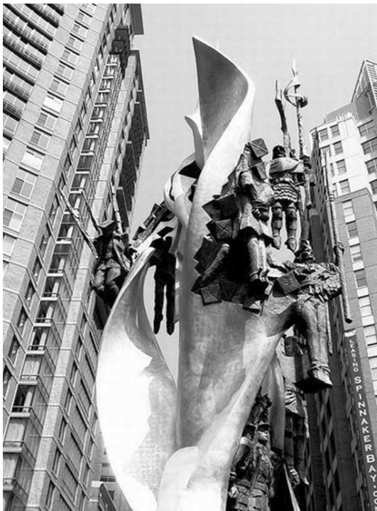
Мемориал в г. Балтиморе (США) как пример тяжелой душевной болезни, поразившей многих, упивающихся трагедией Катыни