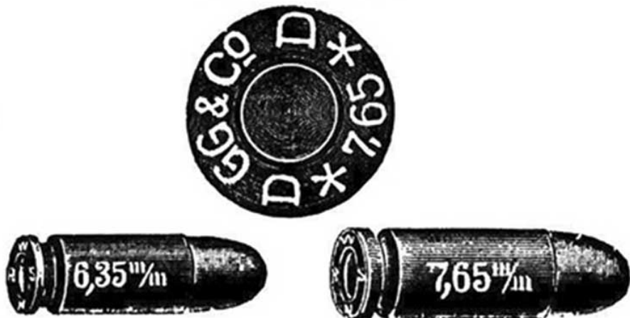
Образцы патронов, которыми были расстреляны поляки в Катыни

В этой связи напомним судьям и экспертам ЕСПЧ еще одно установленное историческое свидетельство. Известно, что немецкие эксперты в 1943 году, а польские в 1994-1995 гг. нашли в катынских захоронениях значительное количество гильз от немецких патронов «Geco 7,65 D» со следами сильнейшей коррозии. Как установлено, гильзы были не латунными, а стальными.